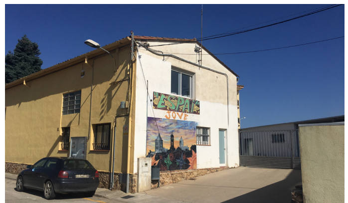
Il·luminar la via verda i l'Espai Jove, dues propostes